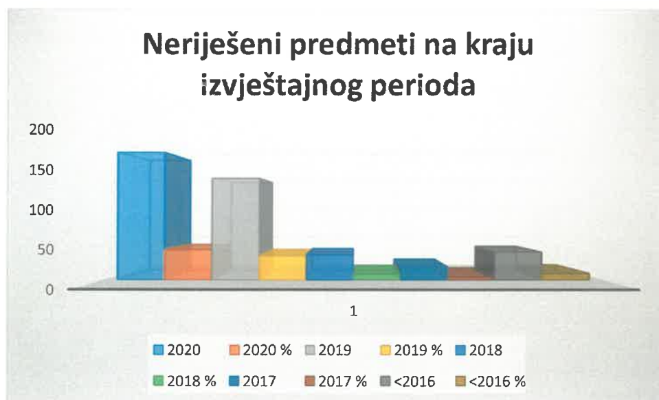
Grafički prikaz broja neriješenih predmeta na kraju izvještajnog perioda prema starosti inicijalnog akta