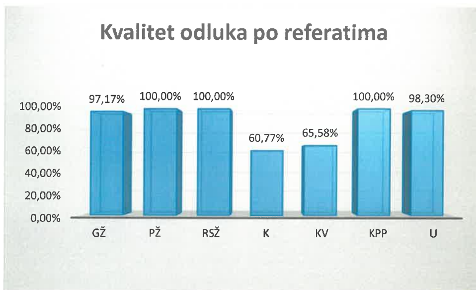
Grafički prikaz kvaliteta odluka po referatima

Za drugostepene građanske predmete (GŽ) kvalitet sudskih odluka iznosi 97,17%, za drugostepene privredne predmete (PŽ) 100,00%, za drugostepene predmete radnih sporova (RSŽ) 100,00 %, za prvostepene krivične predmete (K) kvalitet iznosi 60,77 %, za Kv predmete 65,58%, za Kpp predmete 100 %, a za predmete upravnih sporova 98,30 %.