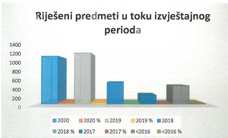
Grafički prikaz broja riješenih predmeta u toku izvještajnog perioda prema starosti inicijalnog akta