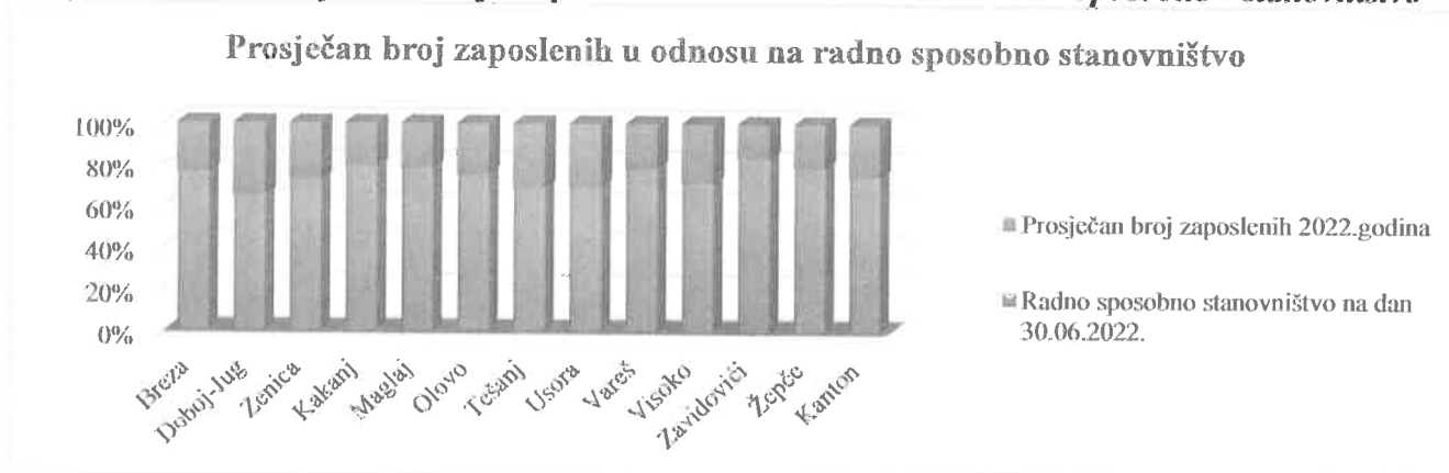
Grafikon 2.1. Prosječan broj zaposlenih u odnosu na radno sposobno stanovništvo