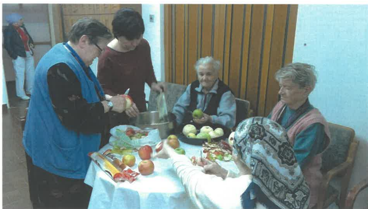
Radno okupacione aktivnosti