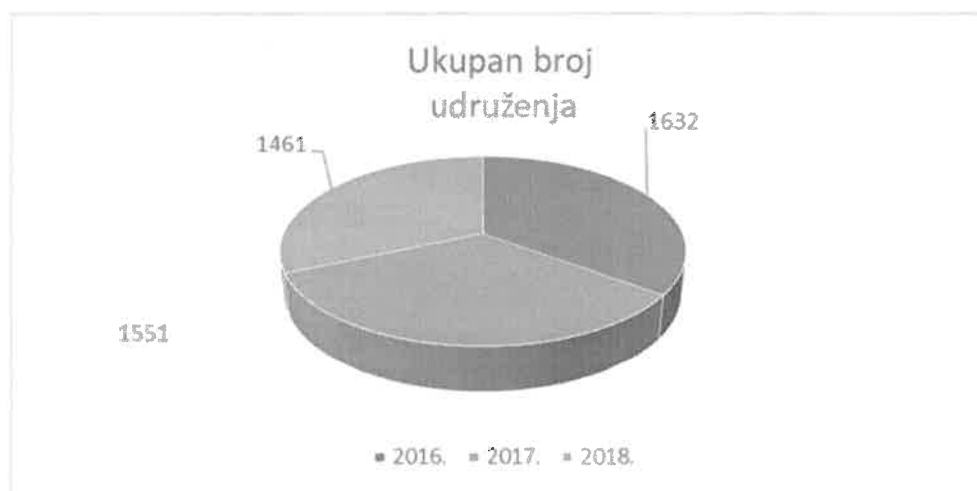
Grafički prikaz 1.

Smanjenje broja udruženja rezultat je činjenice da mnoga udruženja nisu postupila u skladu sa članom 33. Zakona o udruženjima i fondacijama Federacije Bosne i Hercegovine, po kojem su dužna kantonalnom organu prijaviti svaku promjenu statuta, naziva, sjedišta, djelatnosti, lica ovlaštenih za zastupanje i predstavljanje, članova organa upravljanja, pripajanja, razdvajanja ili transformacije i prestanka rada udruženja, odnosno fondacije u roku od 30 dana od dana izvršene promjene. Prema udruženjima koja nisu postupila po odredbama navedenog člana, preduzimaju se radnje iz člana 43. stav 2. tačka 1. Zakona o udruženjima i fondacijama Federacije Bosne i Hercegovine, odnosno po službenoj dužnosti pokrenut se pokreće postupak brisanja iz Registra udruženja. Tako je ukupan broj brisanih udruženja iz Registra u 2018 godini 186, dok je u istoj godini podneseno 220 zahtjeva za upis promjena u Registar. Postupajući u skladu sa navedenim odredbama ujedno je resorno ministarstvo izvršilo i ažuriranje stanja u registru, odnosno usaglasilo isti sa faktičkim stanjem na terenu.