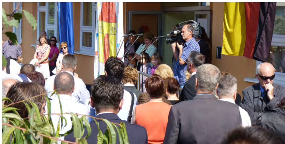
Otvorenje zgrade Centra u septembru 2009. godine

Obzirom da se oblast ranog podsticanja u BiH nalazi još u fazi razvoja i osim predmetnog Centra u Zenici nema ni jedne druge institucije u BiH sličnog profila, prve dvije godine rad Centra se odvijao uz usku saradnju sa njemačkim organizacijama CIM (Centar za međunarodnu migraciju i razvoj) i SES (Servis penzionisanih stručnjaka) putem koje je obezbijeđen transfer know-how i ekspertize iz ove oblasti.