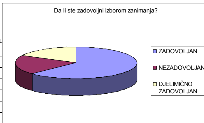
Grafikon 1. Da li ste zadovoljni izborom zanimanja?

završene škole. Tako je 298 ispitanika odgovorilo potvrdno na pitanje "Da li ste zadovoljni izborom zanimanja", (grafikon 1.) 82 je odgovorilo da je djelimično zadovoljno i 94 je bilo izričito nezadovoljno.